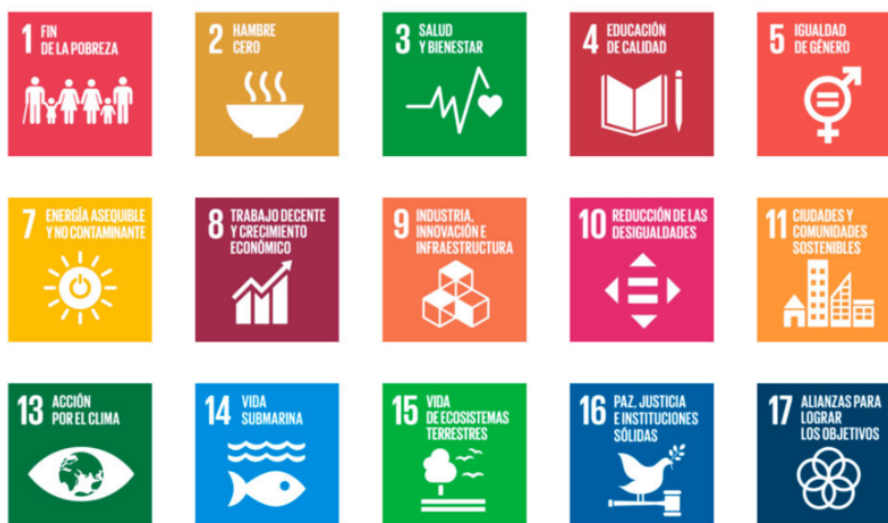
FIGURA 1 Objetivos de desarrollo sostenible

La EC forma parte de un proceso que también el Parlamento Europeo (2021) ha expuesto tal y como aparece en la Figura 1.